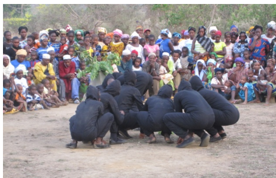
Tournée à Sangaredi, Guinée, Mars 2010

En 2010, la WCF a présenté des pièces de théâtre traitant des relations entre les chimpanzés et les humains, en insistant sur la nécessité de leur protection et de celle de leur habitat, la forêt tropicale. Celles-ci étaient suivies par des discussions avec le public, où les membres des communautés locales pouvaient poser des questions sur les chimpanzés et la biodiversité, mais aussi