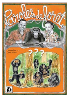
N° 11 de la Newsletter

Le numéro 11 de notre journal Paroles de Forêt a été conçu. Les thèmes abordés sont notamment la migration d'une femelle chimpanzé d'une communauté vers une autre. Une bande dessinée de 8 pages dessinée par Désiré Koffi et Ben Amara Sylla traite de ce comportement migratoire typique des femelles chimpanzés, qui est aussi un important objet d'études pour les primatologues. Les différences culturelles des chimpanzés et les différences dans le cassage de noix entre deux communautés de chimpanzés au sein du Parc National de Taï ont aussi été représentées dans une bande dessinée de 6