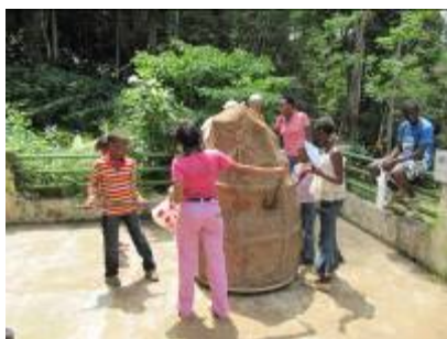
Des visiteurs pêchent les termites comme font les chimpanzés d'Afrique Centrale – Ces ateliers interactifs au sein du Musée permettent d'expliquer les différences culturelles des chimpanzés à travers l'Afrique

Les revenus générés par l'augmentation du nombre de visiteurs au Banco (en 2009 environ 4050 personnes, la moitié du nombre de visiteurs en 2010) ont été réinvestis pour réduire les activités illégales dans le Parc (surveillance) et pour créer plus d'attractions pour les visiteurs (achats de vélos, mise en œuvre de place de jeux pour les enfants)