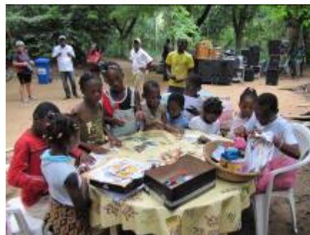
Activités scolaires créatives autour de la nature lors d'une journée spéciale au Banco