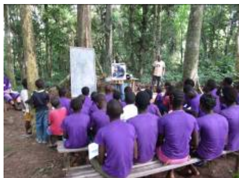
Leçon du Club PAN dans le village forestier de Paule-Oula

Le programme d'éducation dans les écoles primaires autour du Parc National de Taï initié en 2007 avec l'aide des enseignants locaux de la CPE, le Club PAN (Personnes, Animaux, Nature), s'est agrandi en 2010. En effet, durant cette année qui constitue la troisième du programme, nous y avons ajouté deux écoles, portant le nombre d'écoles partenaires à 12.