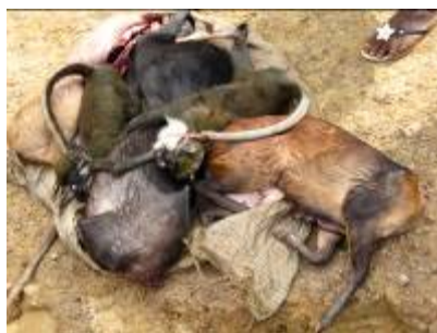
Diverses espèces animales dont certaines en danger vendues dans un marché de viande de brousse proche du Parc National de Taï, vers la frontière Côte d'Ivoire / Libéria

Autour du Parc National de Sapo, au Libéria, la Forestry Department Authority (FDA) et Fauna and Flora International (FFI) réalisent également une étude de la sorte pour mieux comprendre les prélèvements d'animaux dans le Parc. Les résultats seront bientôt disponibles et seront comparés avec les résultats que nous avons réunis autour de Taï.