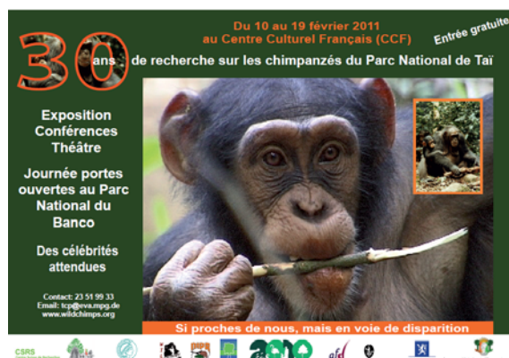
Affiche pour la célébration des 30 ans du TCP à Abidjan

Ce dernier, prévu en décembre 2010, avait d'abord été repoussé à février 2011 à cause de l'instabilité politique du pays après les élections controversées de novembre 2010. L'évènement aura lieu dès que la situation sociopolitique le permet.