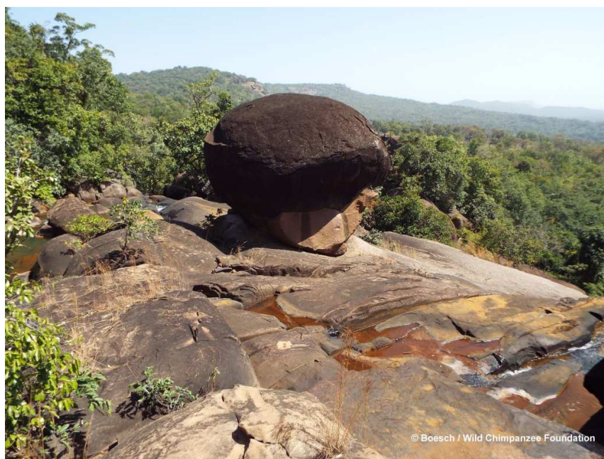
Le parc national du Moyen Bafing en Guinée