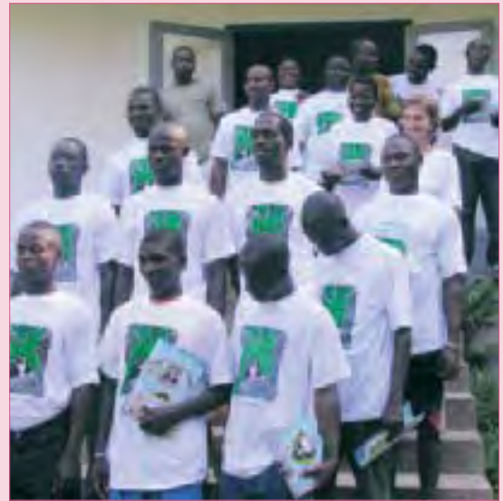
Des écologues et agents des Eaux et Forêts pendant leur formation au Parc National de Taï.

Ces informations sont collectées par des villageois, des agents des Eaux et Forêts et des chercheurs qui emploient des techniques scientifiques sur le terrain et pour les analyses. Les informations obtenues sont destinées aux gestionnaires des parcs comme base pour leurs efforts de protection : ils apprennent ainsi où se trouvent les menaces majeures et peuvent réagir rapidement et efficacement.