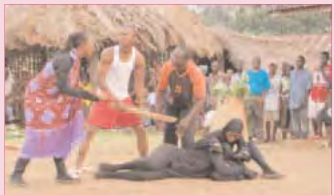
Le théâtre et son public en Sierra Leone.