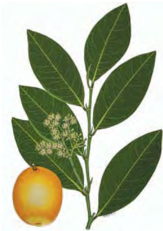
Irvingia gabonensis (Aubry Leconte ex Rorke) Irvingiaceae Noms vernaculaires : Boborou ou Poborou (Abé), Bé (Attié), Brètié (Ebrié), Kalo Kakourou (Gouro), Kpé (Yacouba), Sakosou (Bété), Kplé (Oubi), Kplé-tou (Guéré)

Irvingia est un grand arbre de forme typique qui se trouve surtout dans les forêts tropicales humides et semi-décidues. Le tronc est bien droit avec des contreforts plus ou moins grands à la base. L'écorce est jaune-beige. Les feuilles sont coriaces, brillantes sur les deux côtés et se terminent par des pointes courtes. Au milieu de ces feuilles se trouve une nervure en relief qui donne naissance de part et d'autre à 6 à 8 paires de nervures plus fines. Les petites fleurs jaunes se transforment en fruits de décembre à juin.